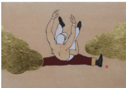
“ライガーボム” 2017 岩絵具、膠、墨、麻紙、金箔、金泥、ほうじ茶 158×227mm

2017 「coma art communication3」アートと珈琲のcoma (三重) 「素描展2017」ギャラリーMOS (三重) 2016 「三重の作家たち展2016」三重県総合文化センター (三重) 2015 「Far East Alliance -エラーが生んだ六つ子達-」Erewhon Center for the Arts (マニラ) 「coma art communication」アートと珈琲のcoma (三重) 「三重の新世代展」三重県立美術館 柳原記念館 (三重) 2014 「亀山トリエンナーレ ART KAMEYAMA 2014」亀山市文化財旧館家 (三重) 「トーキョーワンダーウォール2014入選作品展」東京都現代美術館 (東京) 「4つのしかく展」アートと珈琲のcoma (三重) 2013 「4th現代日本の視覚展」三重県立美術館県民ギャラリー (三重) 「アートハウスあいち展vol.4」アートハウスあいち (名古屋) 2012 「アートハウスあいち展vol.3」アートハウスあいち (名古屋) 「アート亀山2012 『LAUNDRY MUSEUM』」(三重) 2006 「第15回奨学生美術展」財団法人 佐藤国際文化育英財団 佐藤美術館 / 東京