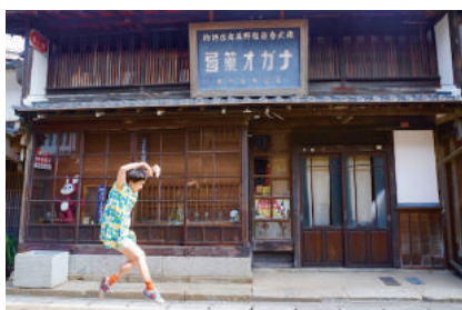
“亀山ビルエット” 2017 ダンス×コマ撮りアニメーション