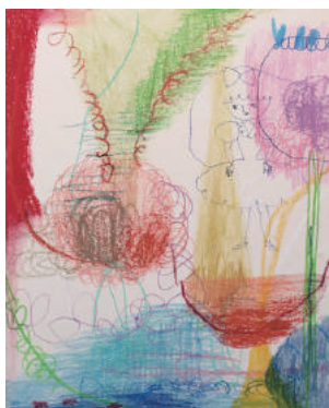
“ただよう” 2018 パステルクレヨン、色エンピツ、インク 275mm × 222mm

2018 「綴り - VAN competition2018」株式会社ベリタス オフィス内 (東京) 2017 「亀山トリエンナーレ2017」岡田屋本店月の庭・奥庭 (三重) 「石橋財団・東京藝大油画 海外派遣奨学生展」陳列館, 東京藝術大学 (東京) 「アート・イン湯宿2017」みなかみ町湯宿温泉 (群馬) 「Rêver 2074 - 2074,夢の世界」大学美術館 B2F, 東京藝術大学 (東京) 「Through The Glass - AGC旭硝子×藝大 成果報告作品展」AGC Studio 2F 京橋 (東京) 「新鋭アーティスト発信プロジェクト A-Lab Artist Gate 2017」A-Lab (兵庫) 「第65回 東京藝術大学卒業・修了作品展」絵画棟F8, 東京藝術大学 (東京)