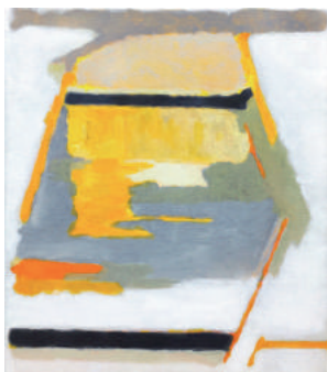
“所在の容” 2018 油絵の具、キャンパス 530×455mm